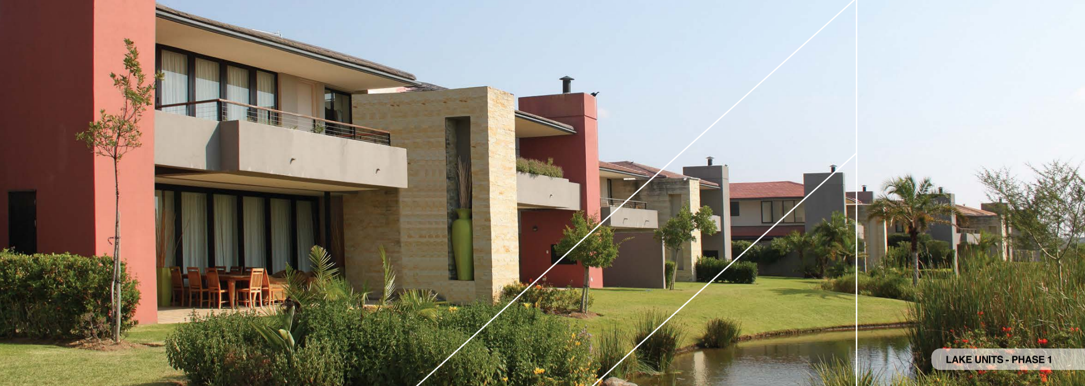
LAKE UNITS - PHASE 1